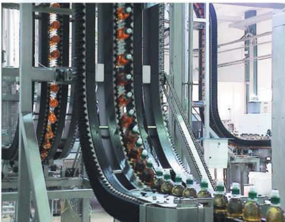
Deckelbenetzer für die Kalt- und Heissabfüllung von Softdrinks wie Fruchtsaft usw. Eine einfache und kostengünstige Lösung um Flaschen zum Zwecke der Kopfraumbenetzung zu kippen oder zu wenden. Durch unterschiedliche Bauformen können die Anlagen direkt in die Linie integriert oder als Bypass-Lösung eingebunden werden.