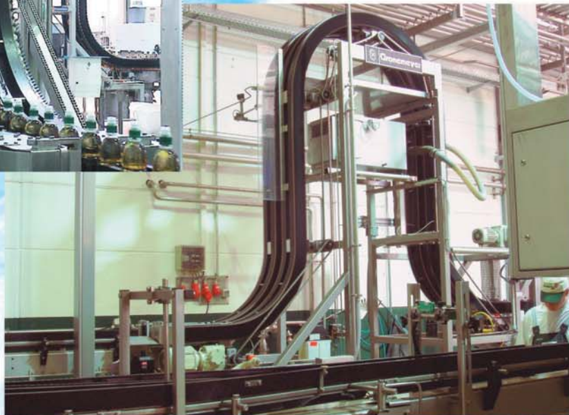
Necksterilizer for cold and hot filled soft drinks, such as juice etc. A simple and favourable solution moistening the bottle necks by turning and tilting. By the use of various construction possibilities, it is possible to integrate the machine directly into the existing line or design it as a bypass alternative.